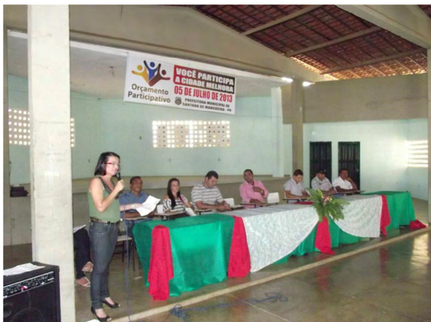
Fonte: Audiência Pública 2013