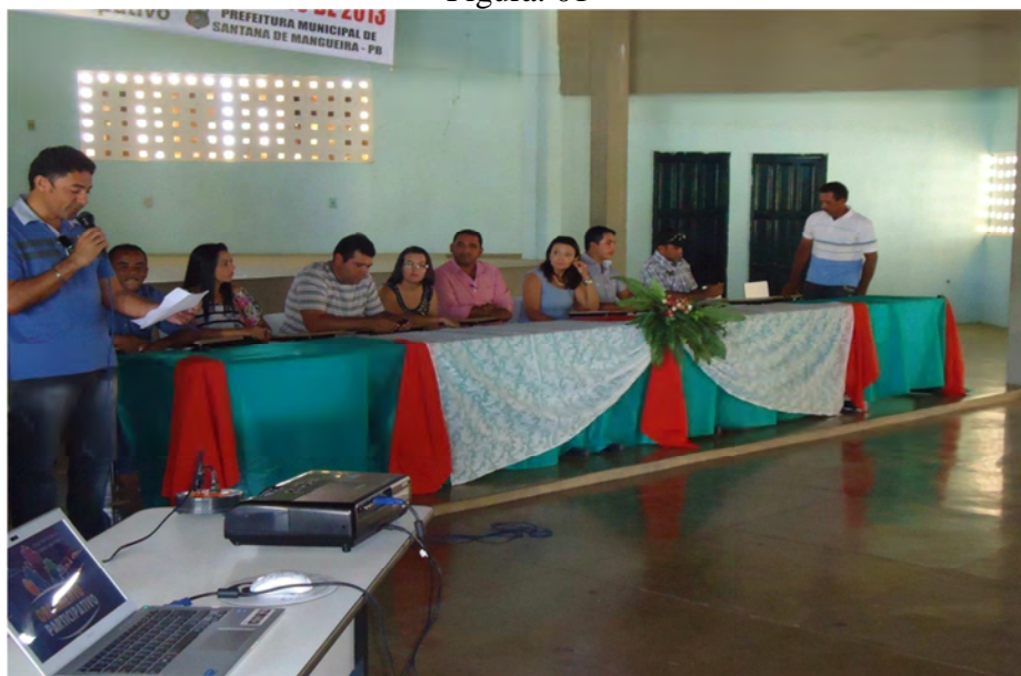
Fonte: Audiência Pública 2013