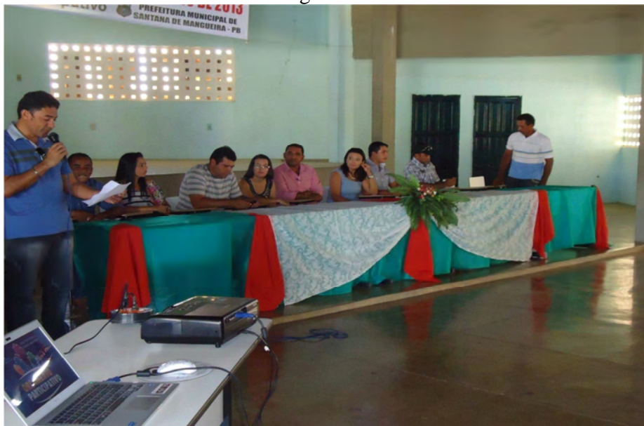
Fonte: Audiência Pública 2013